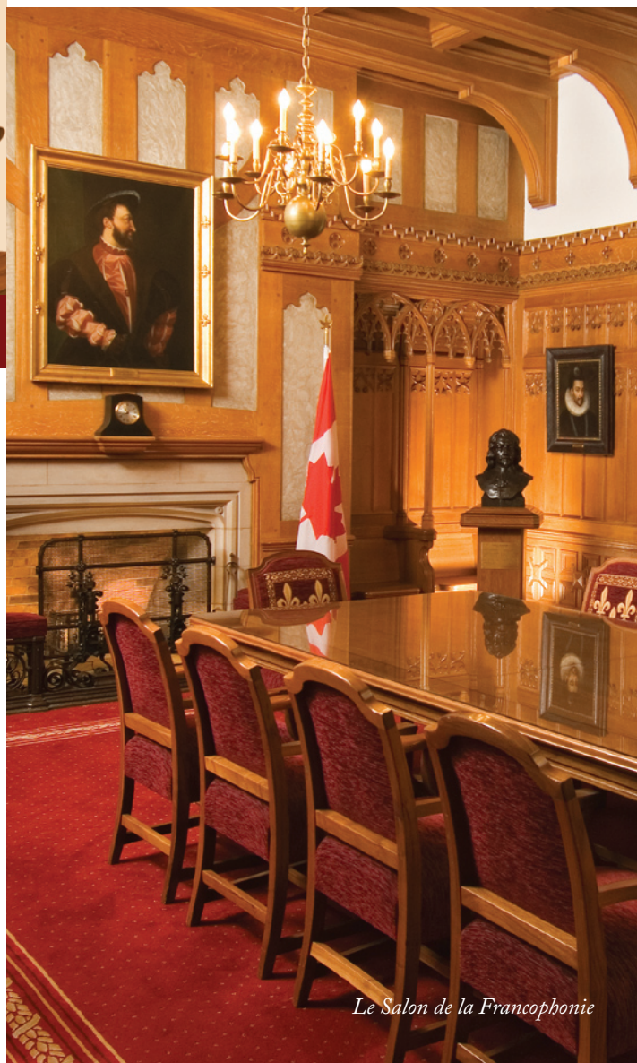
Le Salon de la Francophonie

Une autre œuvre d'art représentant Champlain se trouve dans le Salon de la Francophonie, une salle de réunion à deux pas de la Chambre du Sénat. En plus des portraits des rois français de l'époque de la Nouvelle-France, on trouve au Salon un buste en bronze de Champlain grandeur nature. Ce buste, identique à celui qui a été présenté à l'Assemblée nationale, a été moulé à partir du même modèle numérisé.