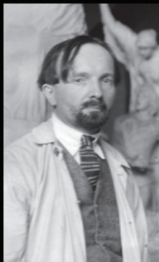
Alfred Laliberté (1878-1953)

Alfred Laliberté est un des artistes les plus aimés des Québécois. Né à Sainte-Élisabeth-de-Warwick en 1878, il étudie les beaux-arts à Montréal et à Paris. En 1907, il devient professeur au Conseil des arts de Montréal et enseigne à l'École des Beaux-Arts dès son ouverture en 1922.